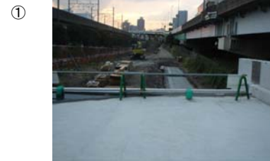
① (取り付け部擁壁基礎)