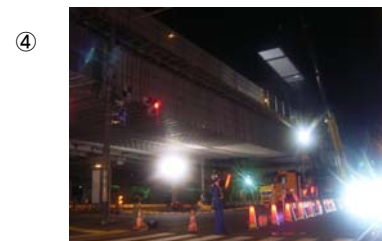
④ (床版設置工事10/31夜間)