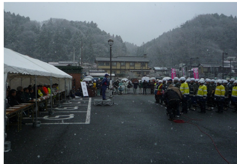
訓練参加者が整列し、高崎河川国道支部長による訓練開始宣言