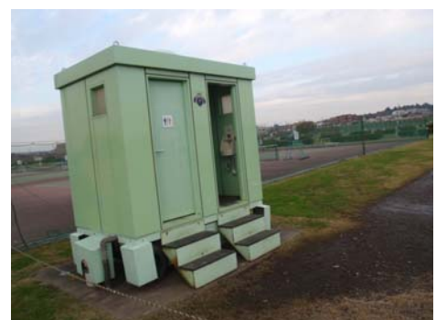
洪水時はトイレも撤去