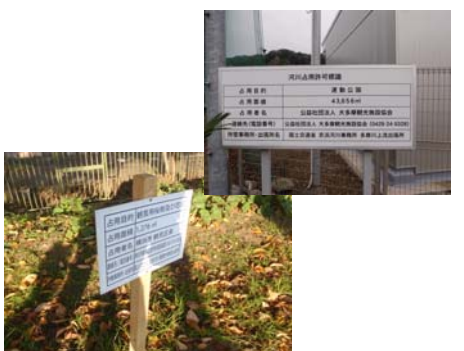
占用許可標識設置状況