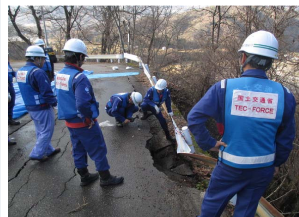
法面動態観測・不安定箇所調査