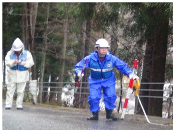
被災状況調査、仮復旧の提案