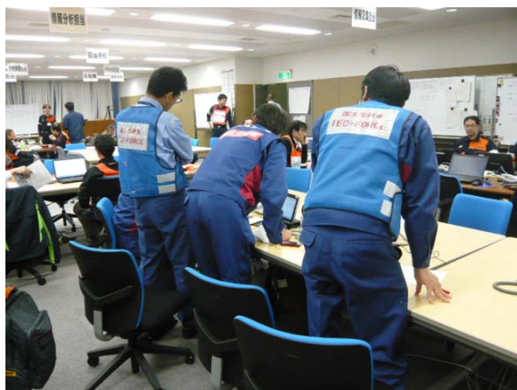
長野県との連絡調整(リエゾン)

延べ275人(12/4まで)のTEC-FORCE(リエゾン含む)を派遣し、道路被災状況の調査、被災村道の応急復旧を実施