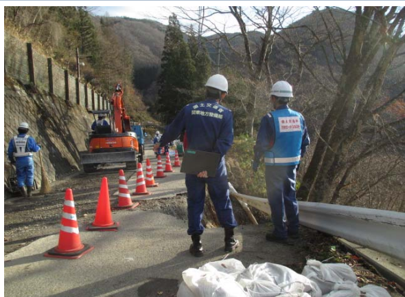
被災箇所の応急復旧工事