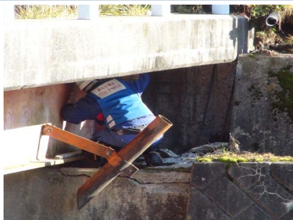
20橋梁の緊急点検の実施