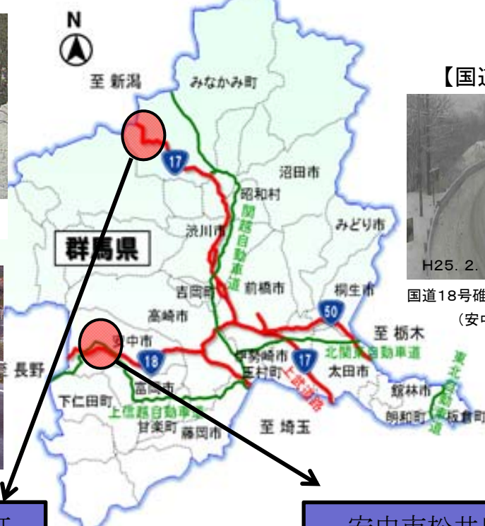
国道18号碓氷バイパス 立ち往生した車両 (安中市松井田町北野牧地先)