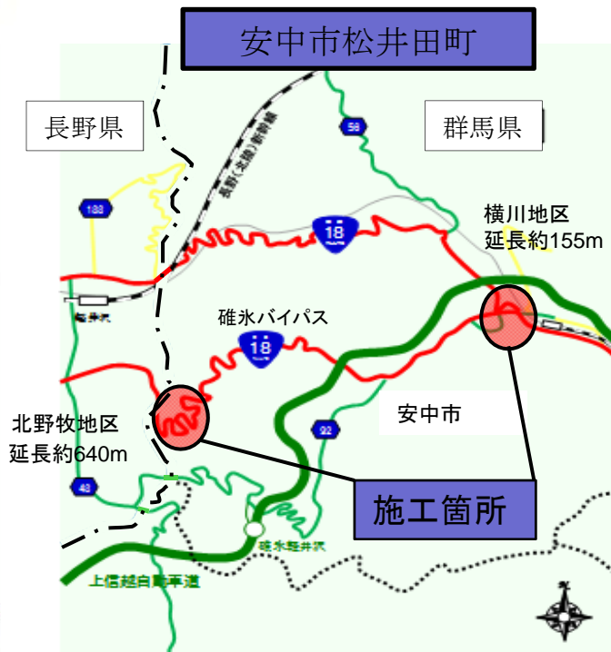
安中市松井田町横川地区及び北野牧地区