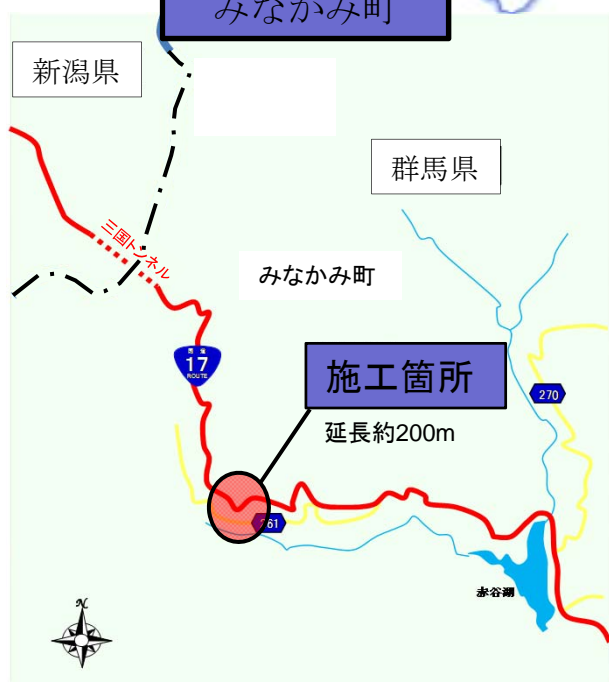
みなかみ町永井地区