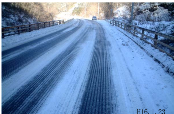
橋面での施工例 県道42号岩手県久慈市