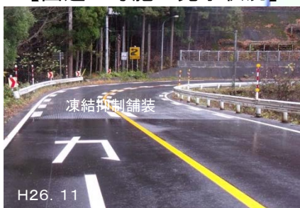
【国道17号施工完了状況】