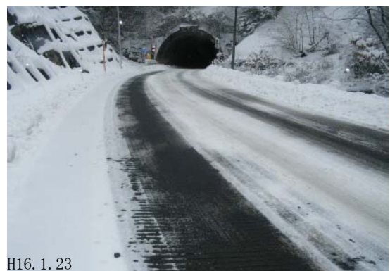
トンネル坑口付近および急カーブでの施工例 県道42号岩手県久慈市