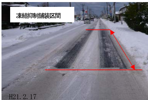
H21. 2. 17 国道253号新潟県上越市