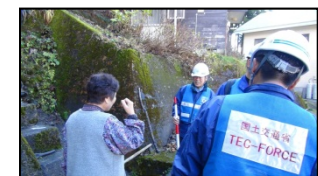
地元住民への聞き取り