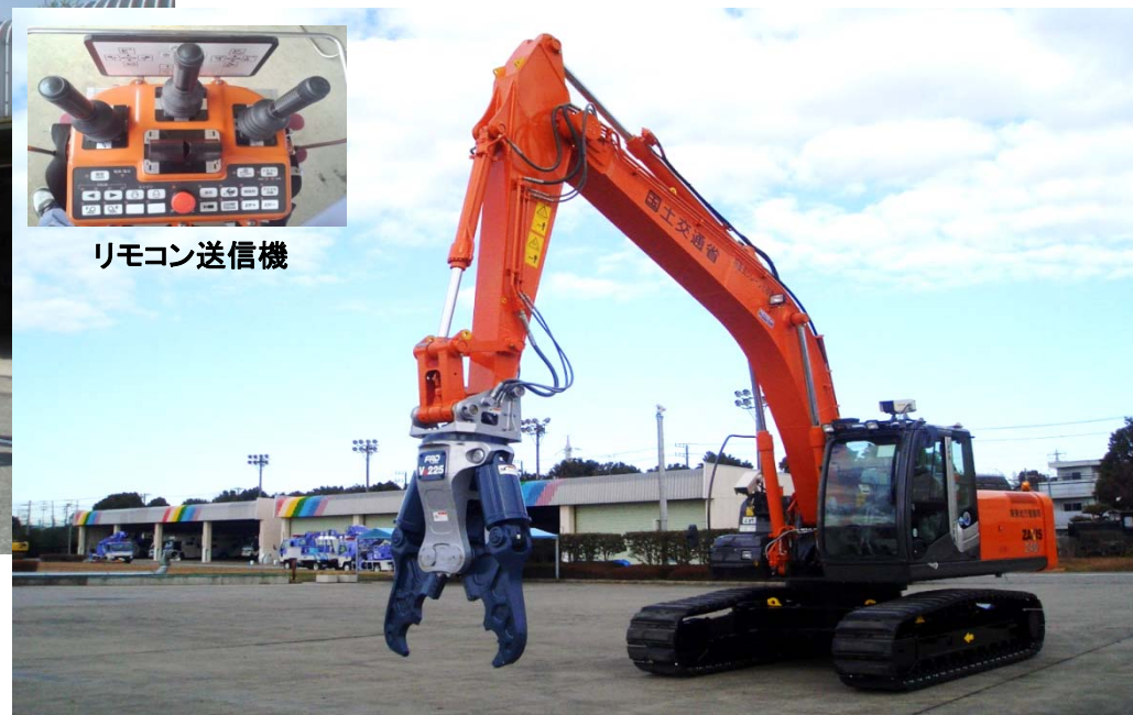
ニブラ(カッター)装着状況

※無人化施工機械は、土砂崩れや岩盤崩落などの危険箇所における作業のため、遠隔操作が可能なバックホウなどの建設機械のこと。