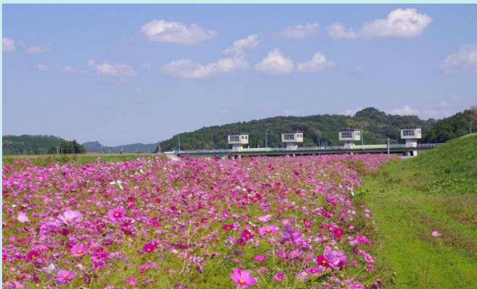
小貝川君島堰下流(真岡市君島) 10月17日撮影