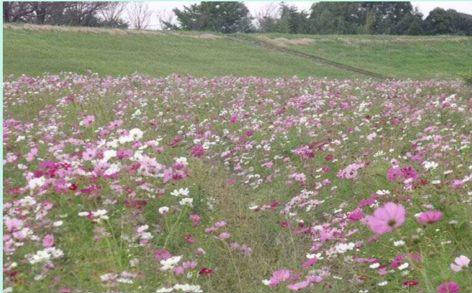
小貝川リバーサイドパーク(取手市藤代) 10月12日撮影