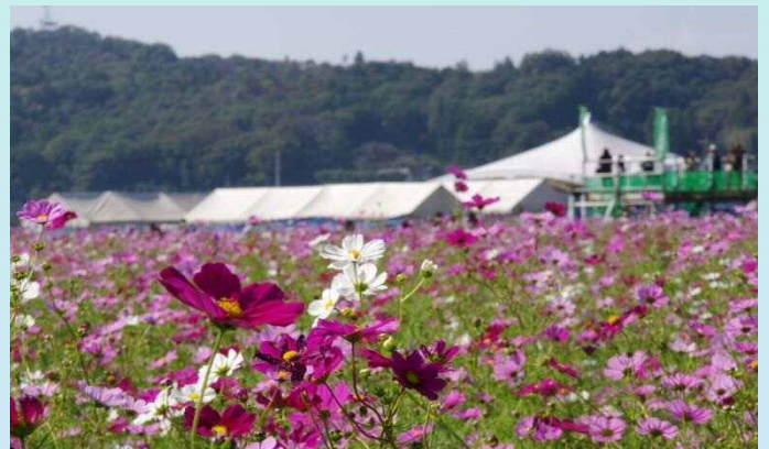
コスモス祭り(益子町生田目) 10月17日撮影