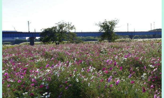
鬼怒緑地運動公園下流(筑西市川島) 10月17日撮影