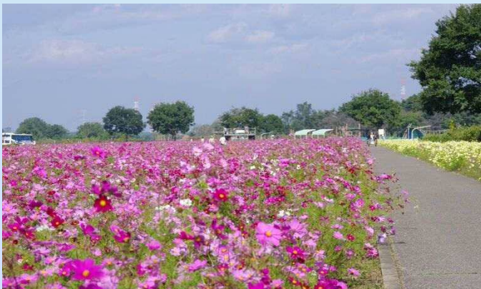
鬼怒グリーンパーク(高根沢町宝積寺) 10月17日撮影

●このrioが皆さんに届いた頃は、もしかしたら終わっているかも知れませんが、来年のこの時期の参考にさせていただければと思います。