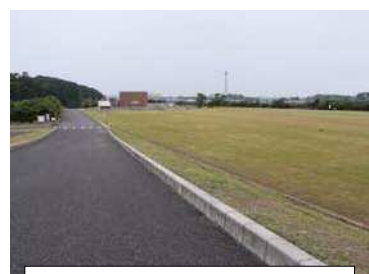
排水機場周辺除草後