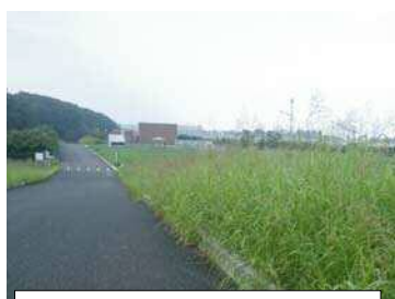
排水機場周辺除草前

首都圏外郭放水路は、高規格堤防の上に建設されています。高規格堤防は計画堤防高さを越えるような大規模な洪水や、地震にも耐えられるように大変緩やかな（1：30）堤防です。平常時は、治水事業や施設について広く知っていただけるように見学会を開催しております。このような状況から、堤防の維持管理や、皆様に快く利用してもらえよう定期的に除草を行っております。