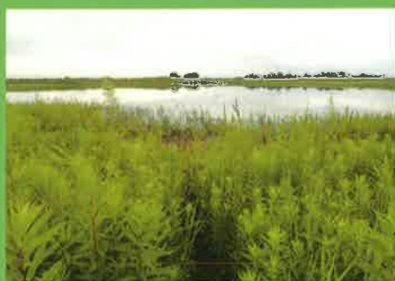
【セイタカアワダチソウ】

栃木県では、関係行政機関や団体、ボランティアの方々とともに外来植物除去活動を実施し、遊水地の希少植物の保全を図ります。