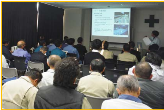
工事施工安全研究発表会の様子