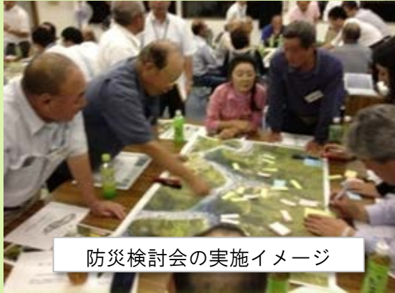
防災検討会の実施イメージ