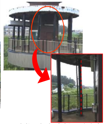
支柱の傾きが確認できます