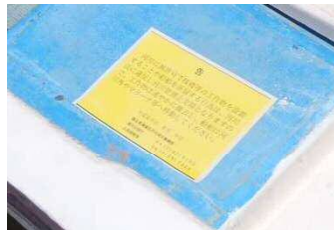
不法係留船には全て警告書を貼付し、是正指導を行いました