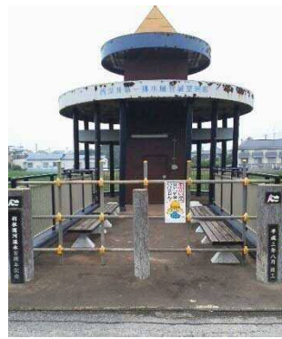
平成3年より地域の皆様に親しまれておりますが、暫定的に立入禁止としました

国土交通省では、5月の大型連休前と7月の夏休み前に河川施設の安全利用点検を実施しています。今回、7月に行った点検において、西深井第一樋管(流山市西深井地先)の屋根を支える柱に異常な傾きが確認されました。その後の調査により、直ちに倒壊するような危険性は少ないようですが、今後補修が完了するまで当面の間は立入禁止としますので、ご理解の程よろしくお祈いします。補修の時期等が決定しましたら、今後「運河だより」でもお知らせします。