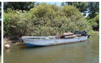
確認された不法係留船の一例