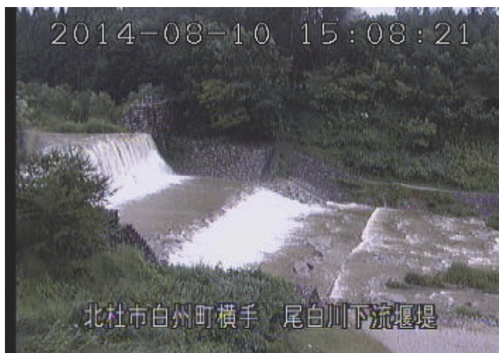
尾白川下流砂防堰堤（北杜市） （8月10日 15時08分頃）