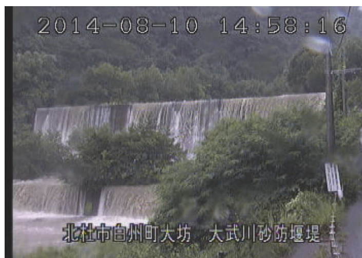
大武川砂防堰堤（北杜市） （8月10日 14時58分頃）