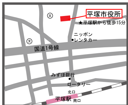
平塚市役所案内図

電話番号は、雨天中止時の緊急連絡に使用するため、できるだけ携帯電話としてください。 今後、同様のイベントを行う際に、お知らせを希望される方は、e-mailアドレスもご記入ください。 記載いただいた個人情報を上記以外の目的で使用することはありません。