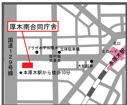
厚木南合同庁舎案内図