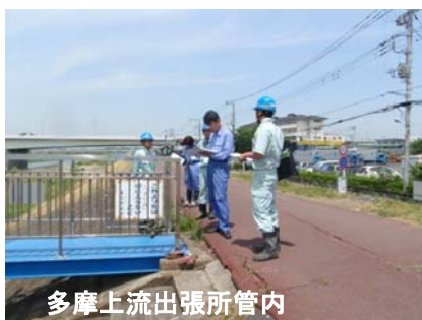
多摩上流出張所管内