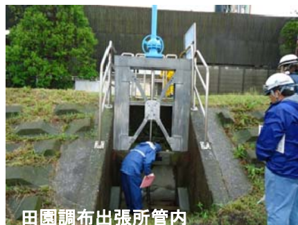
田園調布出張所管内