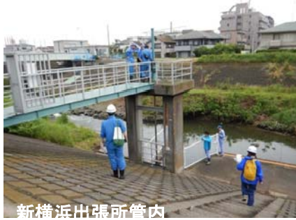
新横浜出張所管内