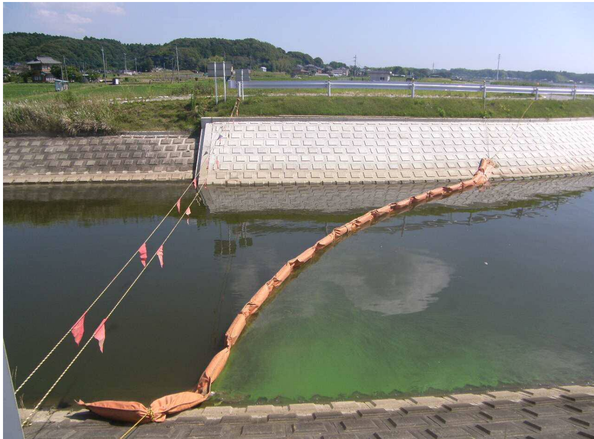
アオコフェンス設置状況