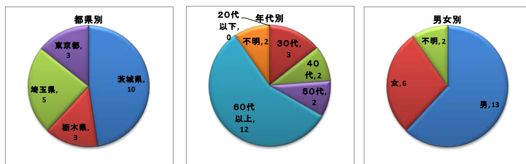
図 6.2-2 意見提出者の属性