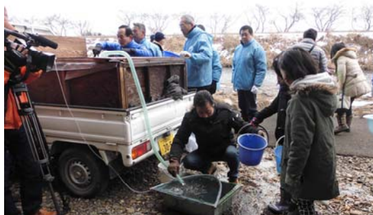
稚魚を受け取る参加者