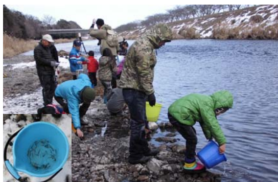
稚魚を放流する参加者

勤行川に鮭の稚魚を放流することで、水の事や、自然の大切さを考えるきっかけとなるようお願いされています。当日は、約二百名が参加、約三万五千匹の稚魚を放流しました。また、二月二日(日)には鬼怒川の筑西市女方においても、漁協による鮭稚魚の放流が行われました。