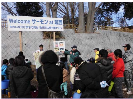
きれいな川はまちの誇り 勤行川に鮭を増やそう

二月十一日(火)、勤行川の筑西市勤行緑地河川敷において、しかもだて紫水ロータリークラブ主催で鮭の稚魚の放流が行われました。