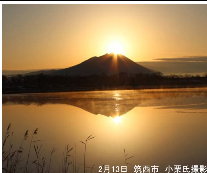
2月13日 筑西市

筑西市の母子島遊水地から見る筑波山はビューポイントです。貯水池越しに筑波山を望む「逆さ筑波」を見られます。特に山頂から太陽が昇る瞬間にダイヤモンドが光り輝くように見える「ダイヤモンド筑波」は二月・十月に見られます。