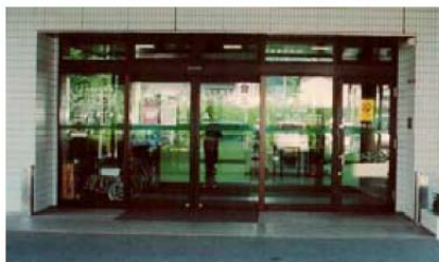
本館玄関への止水板設置状況(設置前)

その後、平成16年以降に、移動できないレントゲン等の医療機器の浸水対策として止水板や防水扉を設置しました。