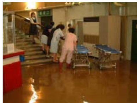
公立豊岡病院の浸水状況(平成16年10月)

平成16年10月の台風23号により兵庫県豊岡市内の公立病院が浸水し、送水ポンプの浸水による断水や、非常用電源も燃料ポンプの浸水で稼働せず一時全館停電となる等の被害が発生しました。入院患者等の2階以上の避難が完了するのに約3時間を要し、非常電源用の燃料をボートで運搬する等の対応に追われました。