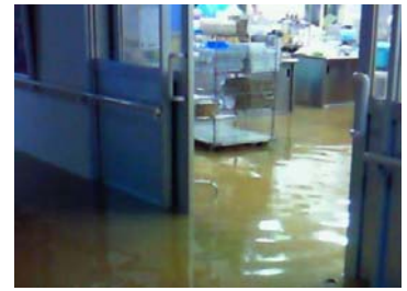
特別養護老人ホーム 幸福園の浸水状況

（例1） 山口県美祢市にある特別養護老人ホームでは、あらかじめ複数の責任者や避難場所（2階）を定めており、平成22年7月の水害では、早朝5時半に現場にかけつけた第3責任者が指揮をとり、1階の浸水が始まる40分前に、寝たきりの多い入所者の避難を完了させました。