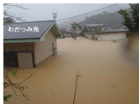
グループホーム わだつみ苑の浸水状況 (平成22年10月奄美豪雨) (出典:奄美市資料)

また、平成22年10月の奄美豪雨災害では、鹿児島県奄美市内のグループホームが浸水し、施設の職員2名が懸命な救出活動を行ったものの、入居者9名のうち2名が死亡しました。