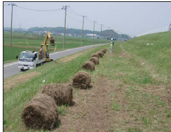
標準的な刈草梱包