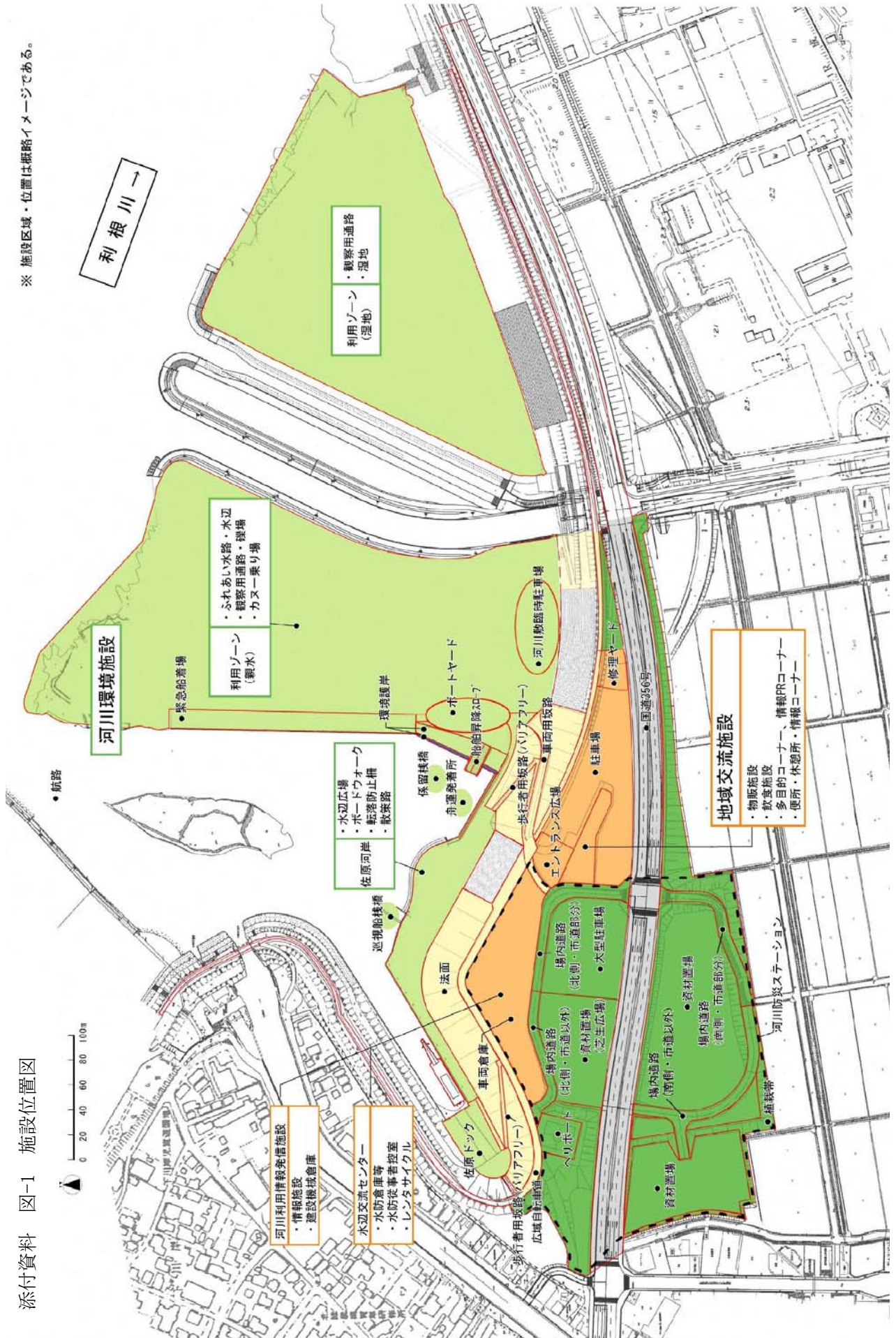
添付資料 図-1 施設位置図