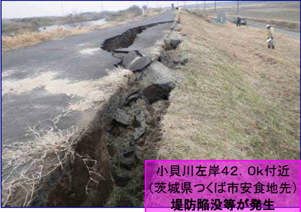
小貝川左岸42.0k付近 (茨城県つくば市安食地先) 堤防陥没等が発生