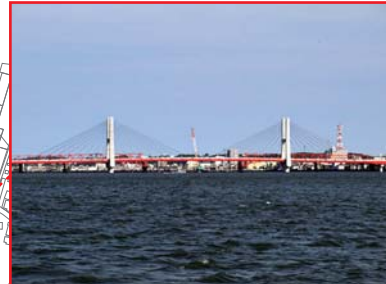
銚子大橋(国道124号) クリアランス:11.5m