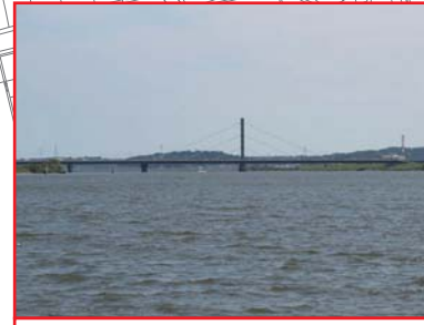
水郷大橋 クリアランス:6.4m