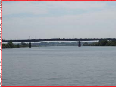
栄橋(県道4号) クリアランス:12.9m