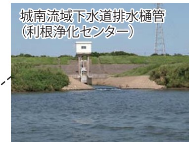
城南流域下水道排水樋管 (利根浄化センター)

注意: 水制が左岸から出ている一方、右岸の一部は岩盤により浅くなっている。 水制の先端付近および浅瀬の先端部には浮標又は竹竿でマーキングされているので、これを目印に通航するとよい。