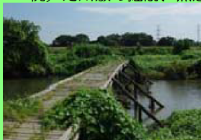
ピオトープの整備