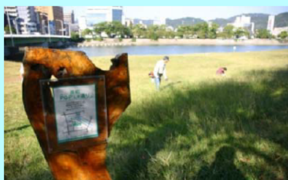
市民団体による看板設置事例（太田川）