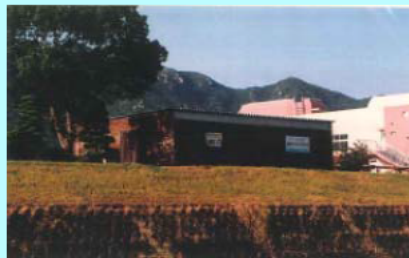
市民団体による活動拠点の整備事例（佐波川）

※ 河川管理者から河川管理施設の維持、除草等の委託を受けることも可能となります。委託先については、公募等の適正な手続きを経て選定を行う予定です。