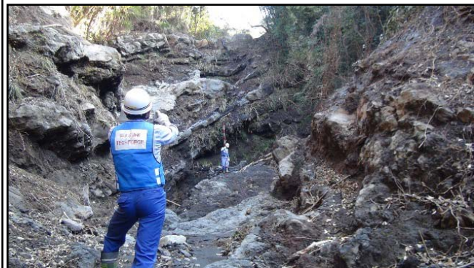
①現地調査・報告状況 (撮影箇所：八重沢地区, [中央]大島町役場)