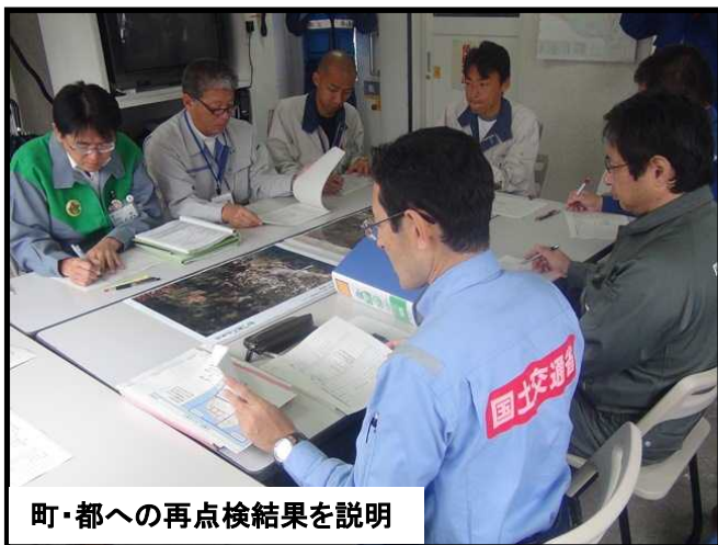
町・都への再点検結果を説明