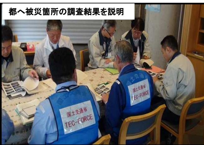
都へ被災箇所の調査結果を説明