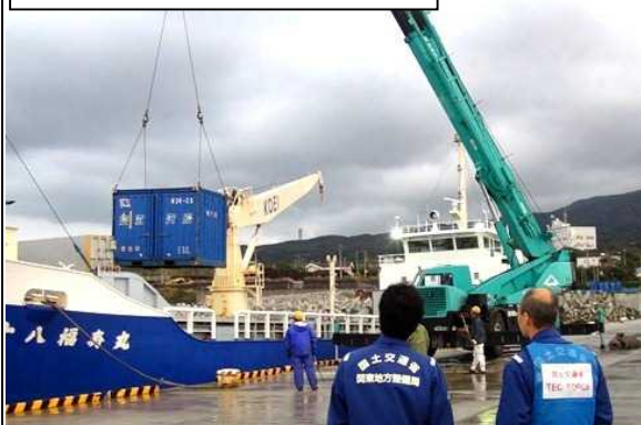
②コンテナ荷下ろし状況