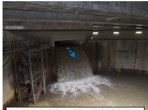
18号水路流入 (第2立坑(内部))