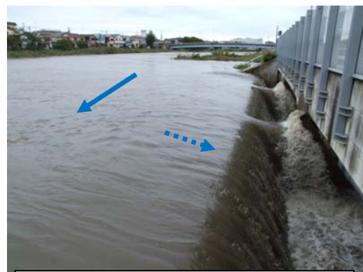
大落古利根川流入 (第5立坑)