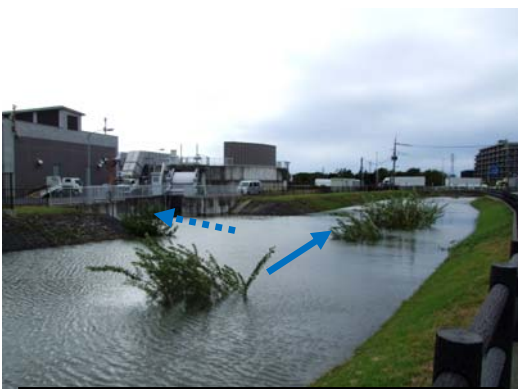
幸松川流入 (第4立坑)