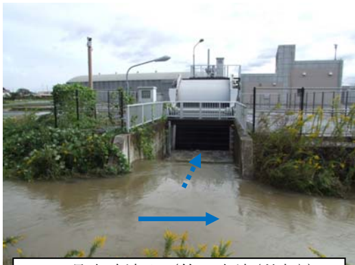
18号水路流入 (第2立坑(外部))