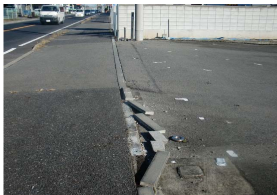
地先境界ブロックの損傷