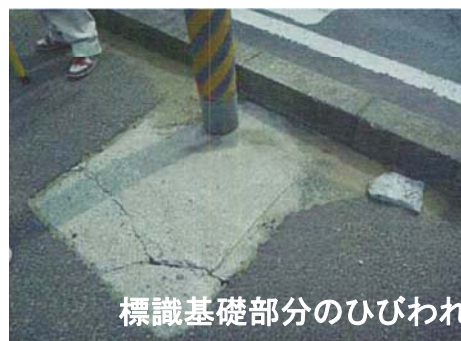
標識基礎部分のひびわれ