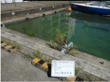
作業前アオコ発生状況①