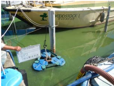
水馬アオコ回収状況①