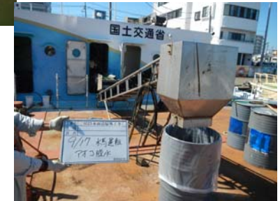
水馬脱水アオコ4本