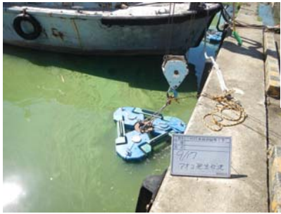
水馬アオコ発生状況①