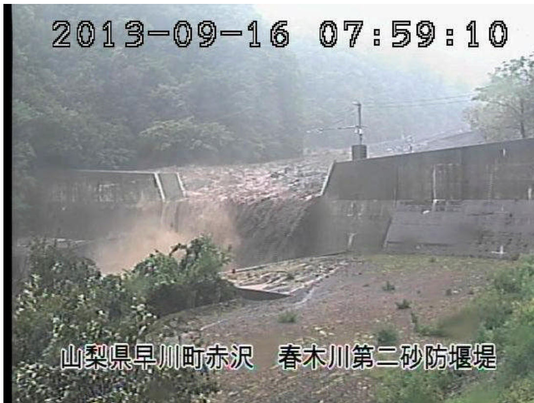
春木川第二砂防堰堤 出水状況（9月16日8時頃撮影）