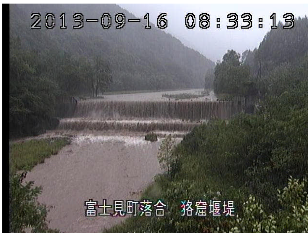
狹窟砂防堰堤 出水状況（9月16日8時頃撮影）