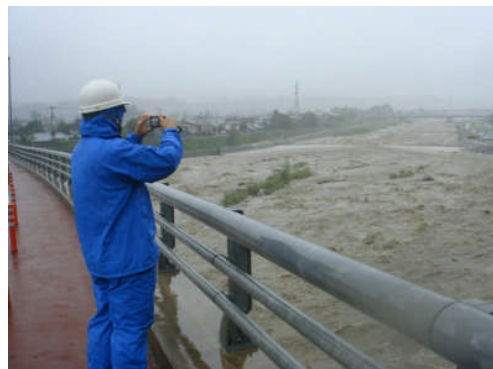
釜無川への大武川合流部(9月16日10時頃)