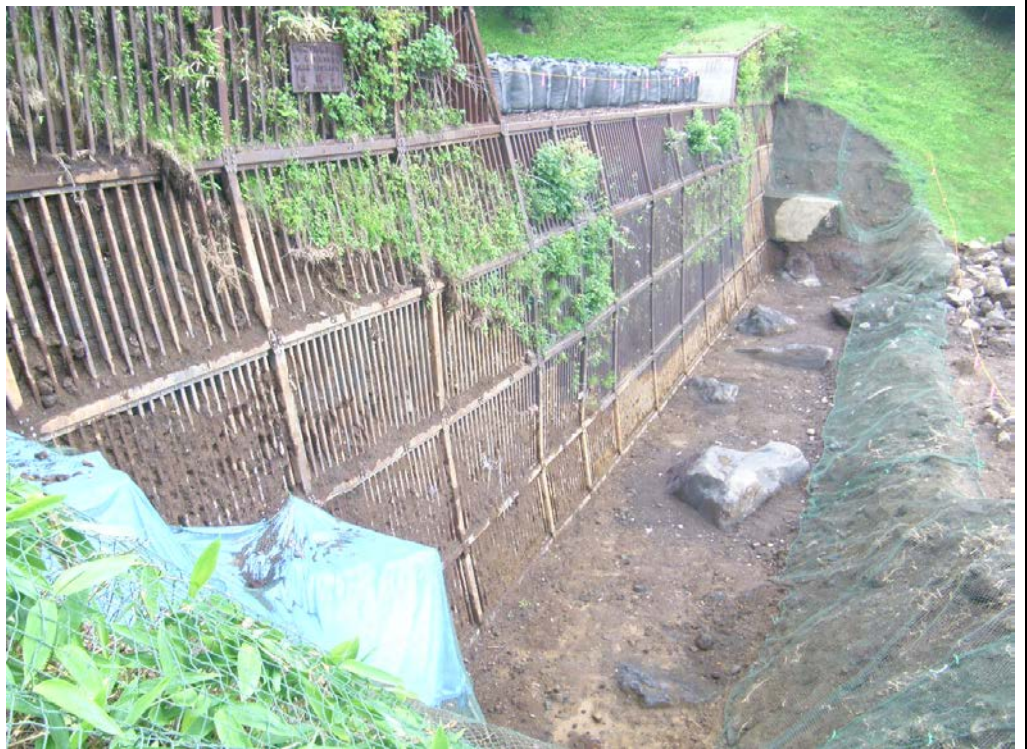
第8床固 平成25年6月末