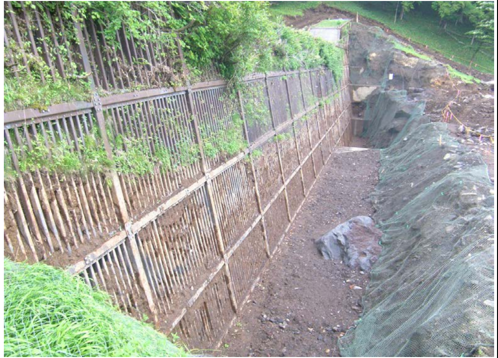
第7床固 平成25年6月末