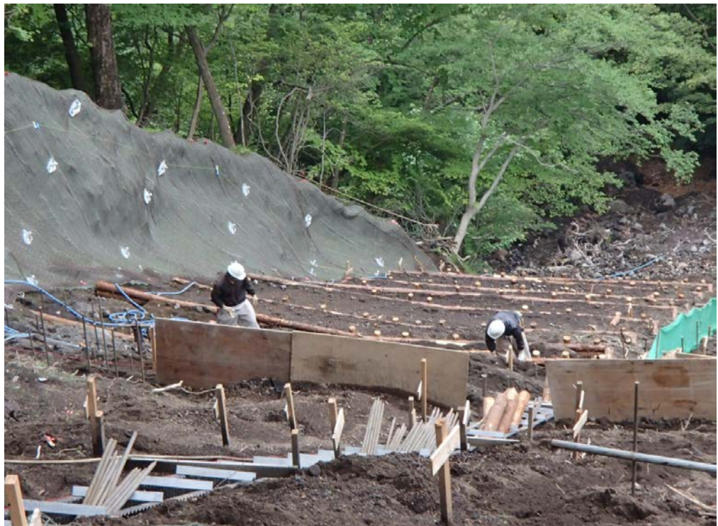
上写真赤○部施工状況