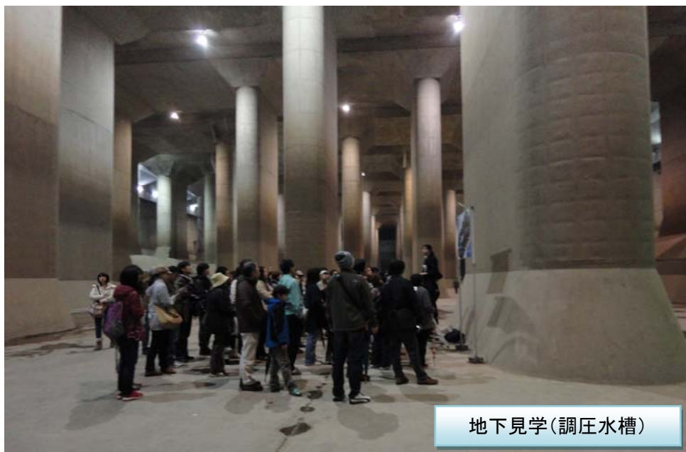
地下見学(調圧水槽)