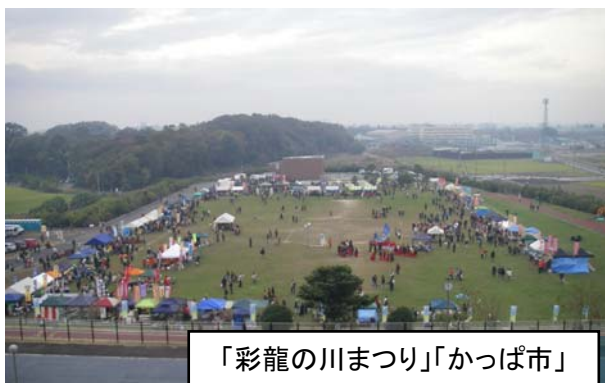
「彩龍の川まつり」「カップ市」

時折小雨の降る、あいにくの天気でしたが、地上（調圧水槽の真上）での「彩龍の川まつり」「カップ市」も合わせると7,000名の方が来場されました。