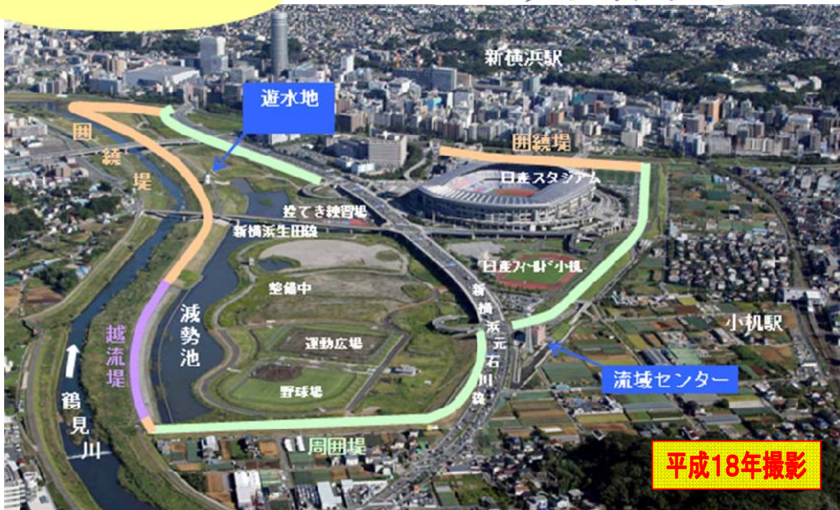
新横浜ゆめ・オアシス