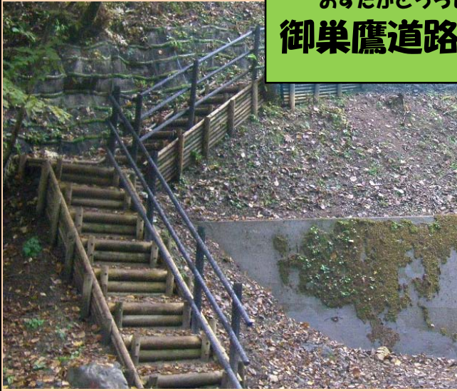
おすたかどうろせいびこうじ 御巣鷹道路整備工事