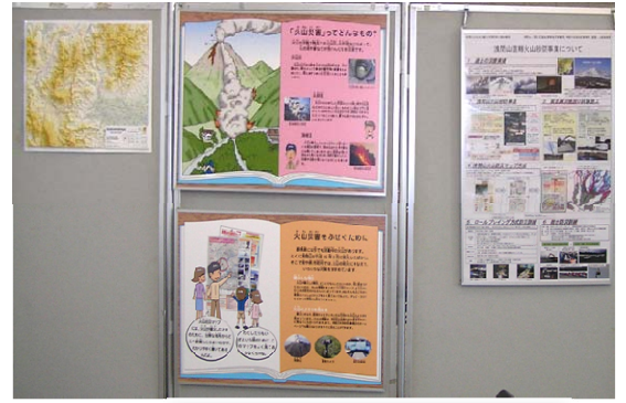
砂防事業の説明パネル (Sand prevention project explanation panel)