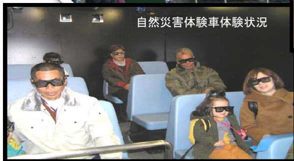
自然災害体験車体験状況