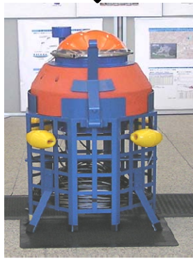
投下型水位観測ブイ (Dredge-type water level observation buoy)