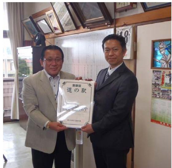
手塚町長 小路事務所長