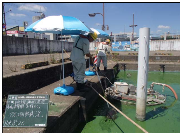
みずすましアオコ回収状況②