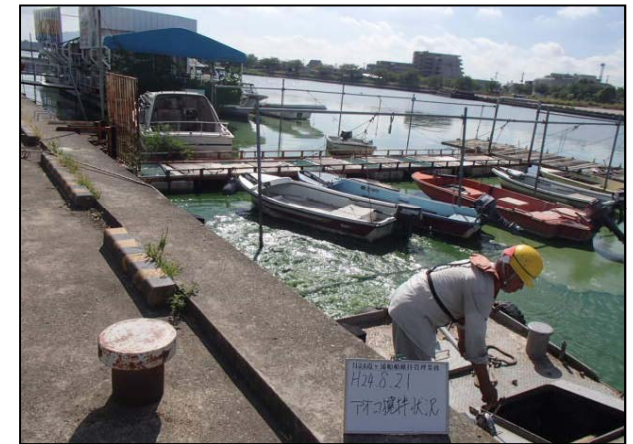
作業船によるアオコ攪拌作業④