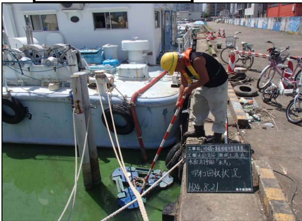
水馬アオコ回収状況①