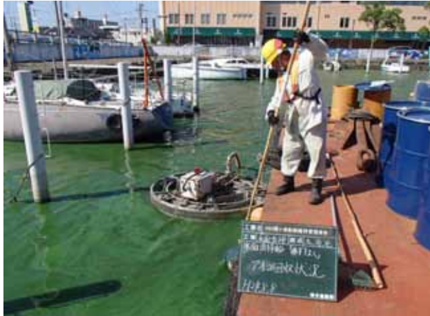
みずすましアオコ回収状況