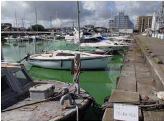
作業前アオコ発生状況