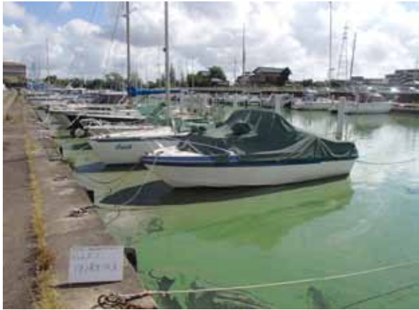
作業前アオコ発生状況