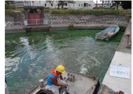
作業船によるアオコ攪拌作業