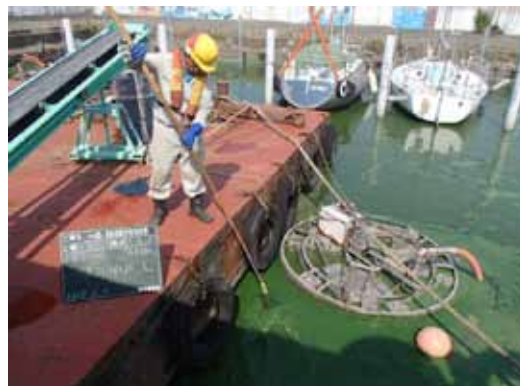
みずすましアオコ回収状況