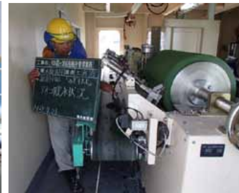
みずすまし脱水状況