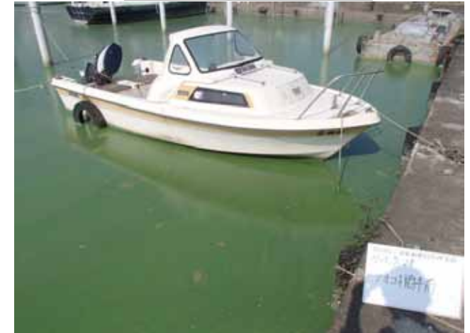
作業船によるアオコ攪拌作業