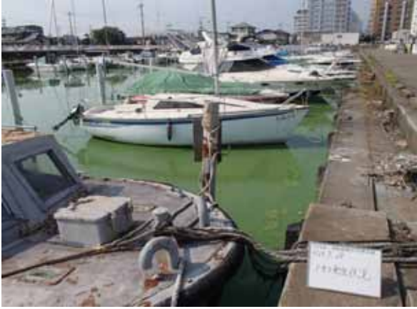
作業前アオコ発生状況