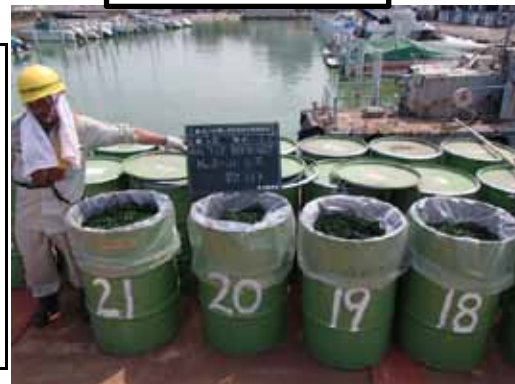
水馬脱水アオコ4本