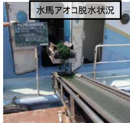
水馬アオコ脱水状況