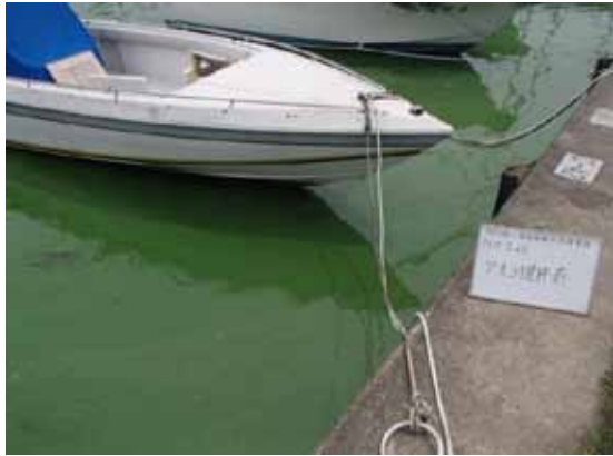
作業前アオコ発生状況