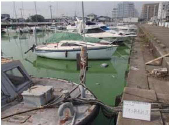
作業前アオコ発生状況