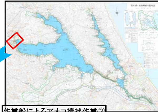
作業船によるアオコ攪拌作業③