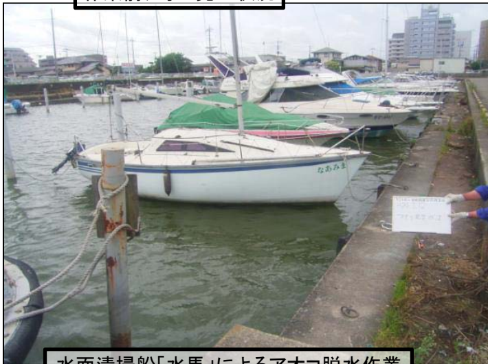
水面清掃船「水馬」によるアオコ脱水作業