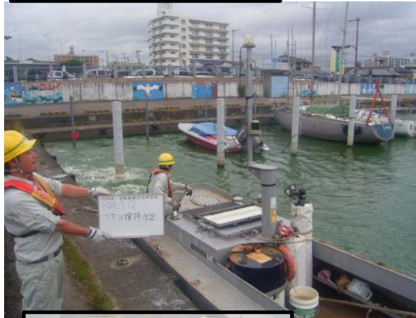
作業船によるアオコ攪拌作業③