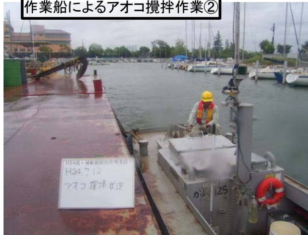
作業船によるアオコ攪拌作業②