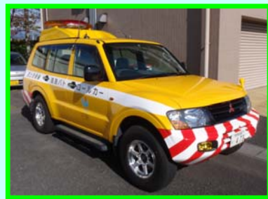
道路パトロールカー