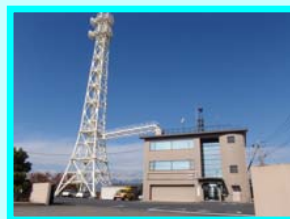
桐生国道維持出張所