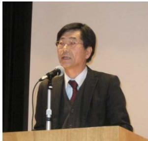
藤井副所長による主催者挨拶