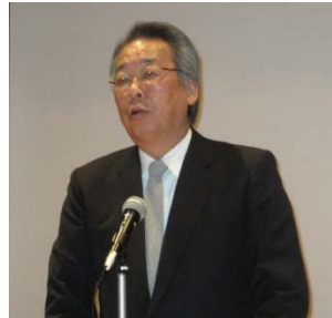
新井藤岡市長による挨拶