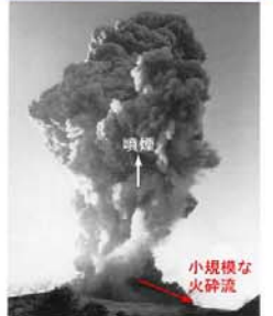
浅間山の小規模な噴火の写真。噴煙とともに小規模な火砕流が発生し斜面に沿って流れました。1973(昭和48)年2月6日撮影。

浅間山は、最近20～30年間は比較的静かな状態が続いています。しかし、明治時代から昭和30年代にかけて、ひんぱんに噴火を繰り返していました。この時期の噴火では、火山灰や噴石、空振、ときには小規模な火砕流などの現象が発生しました。これらの噴火で亡くなった方は、すべて火口から4キロメートル程度以内の範囲にいた登山者でした。浅間山のこのような過去の噴火の経緯から、下のグラフのように、噴火がひんぱんに起こる時期と静かな時期を繰り返していると考えられます。