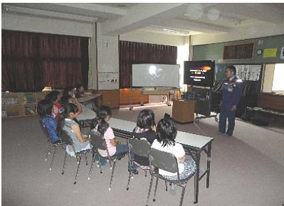
室内での事前学習 (さぼうのお話)