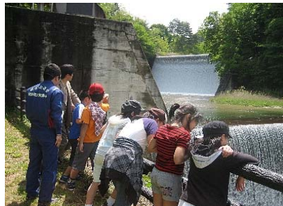
砂防設備の見学 (平川第一砂防堰堤)