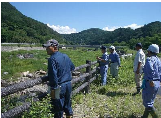
摺溜床固群の点検状況【片品村管内】

毎年、河川に利用者が多く訪れる『ゴールデン・ウィーク』と『夏休み』前の年2回 実施しており、片品出張所では、片品村及び沼田市利根町管内で安全利用点検を行っています。