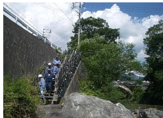
千鳥床固群の点検状況【沼田市利根町管内】