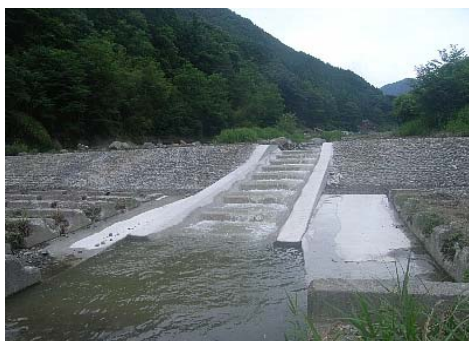
平成23年 7月 1日撮影

本工事は、国道120号を起点とした工事用道路2.3km(路面舗装1.3km・路面整正1.0km)の改良工事を行うものです。写真は起点から0.5km地点に設置した落石防護柵の状況で、これから路面の舗装を実施します。(約90%が完了)